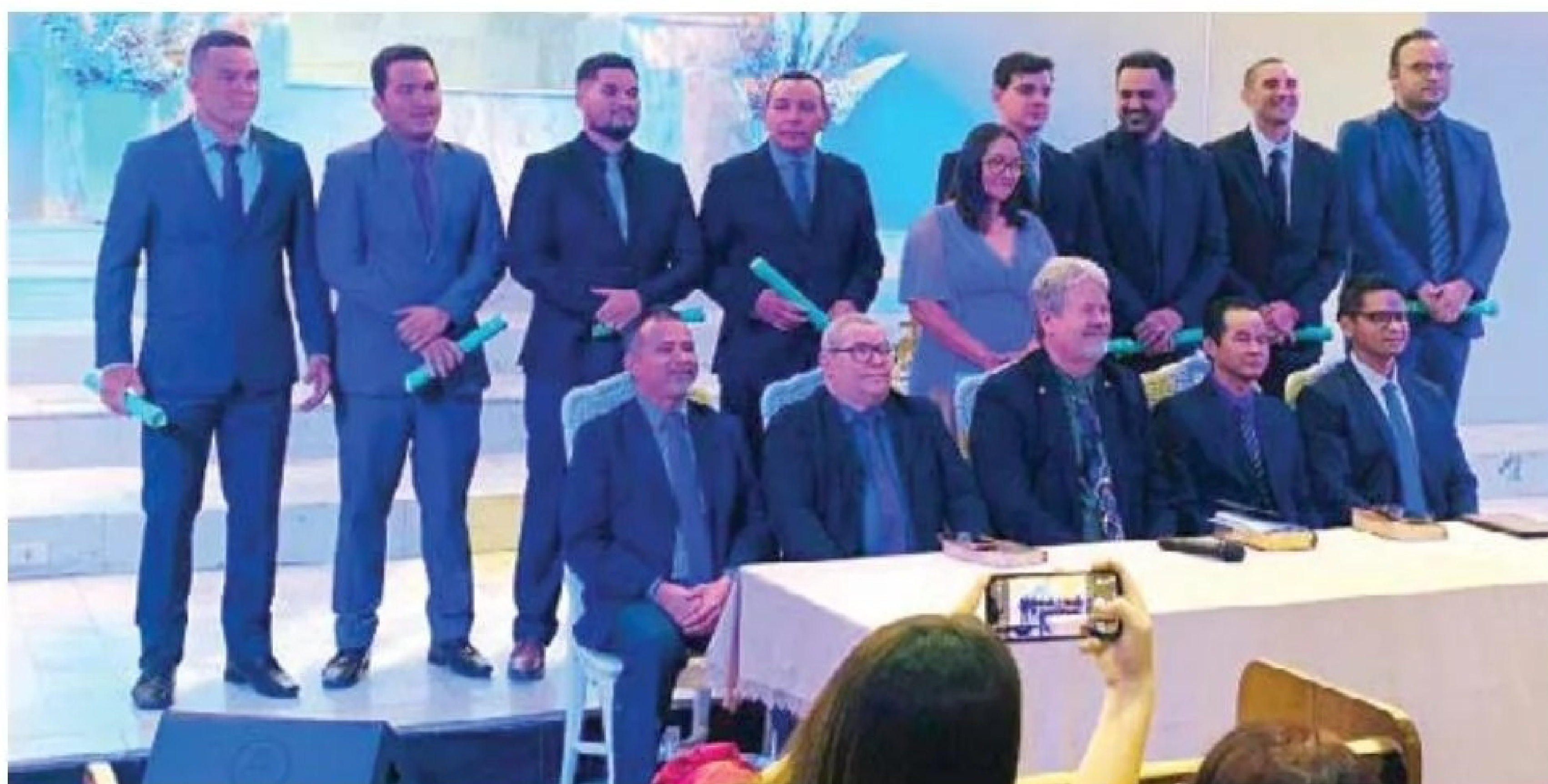
Cerimônia de formatura das turmas de Teologia, Educação Cristã, Capelania Escolar e Aconselhamento de Jovens e Adolescentes realizada pelo Seminário Teológico Batista de Teresina - PI (STBT)