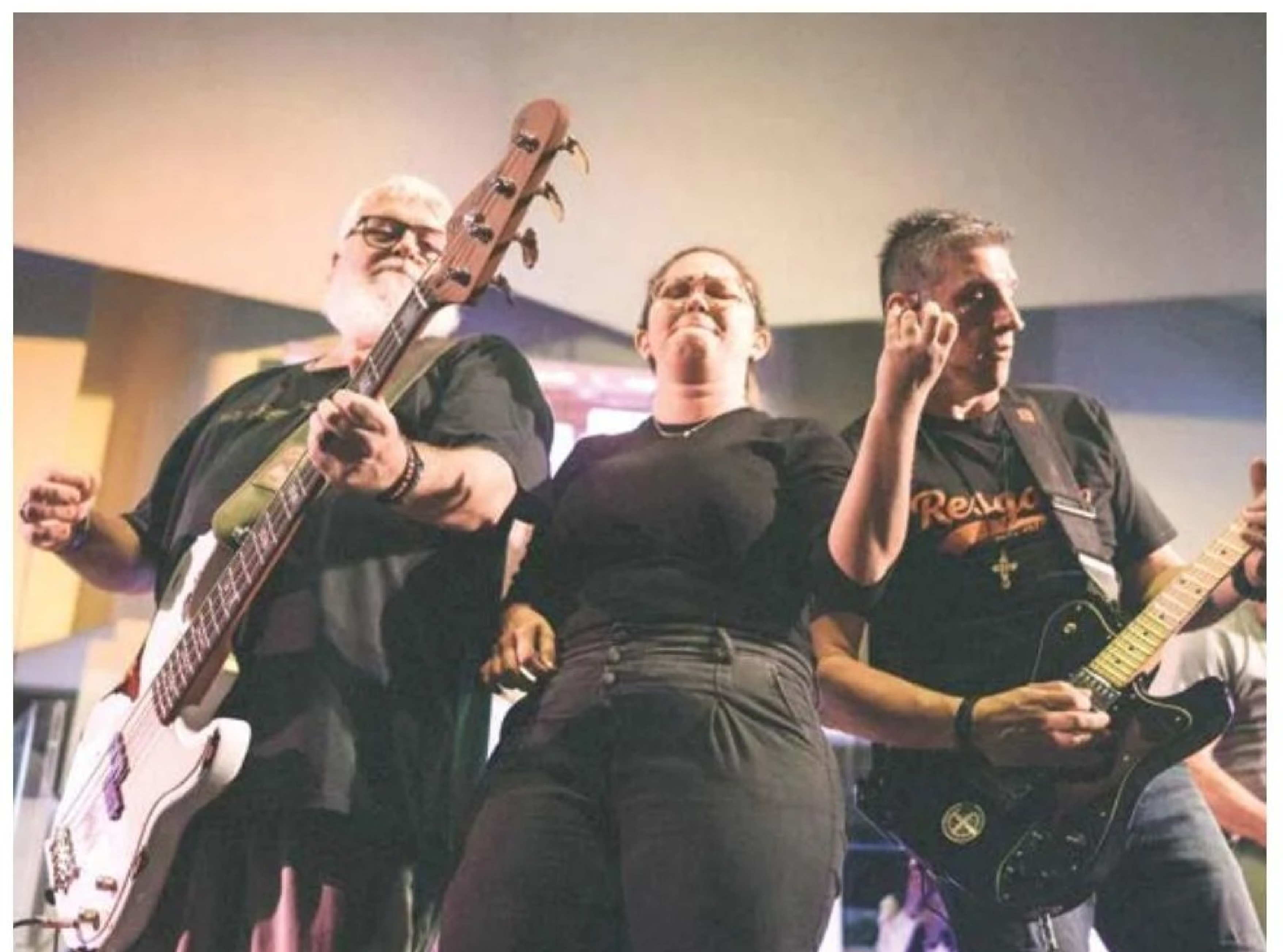
Conferência Despertar, realizada pela Juventude Batista Brasileira (JBB), conscientizou sobre a acessibilidade do Reino