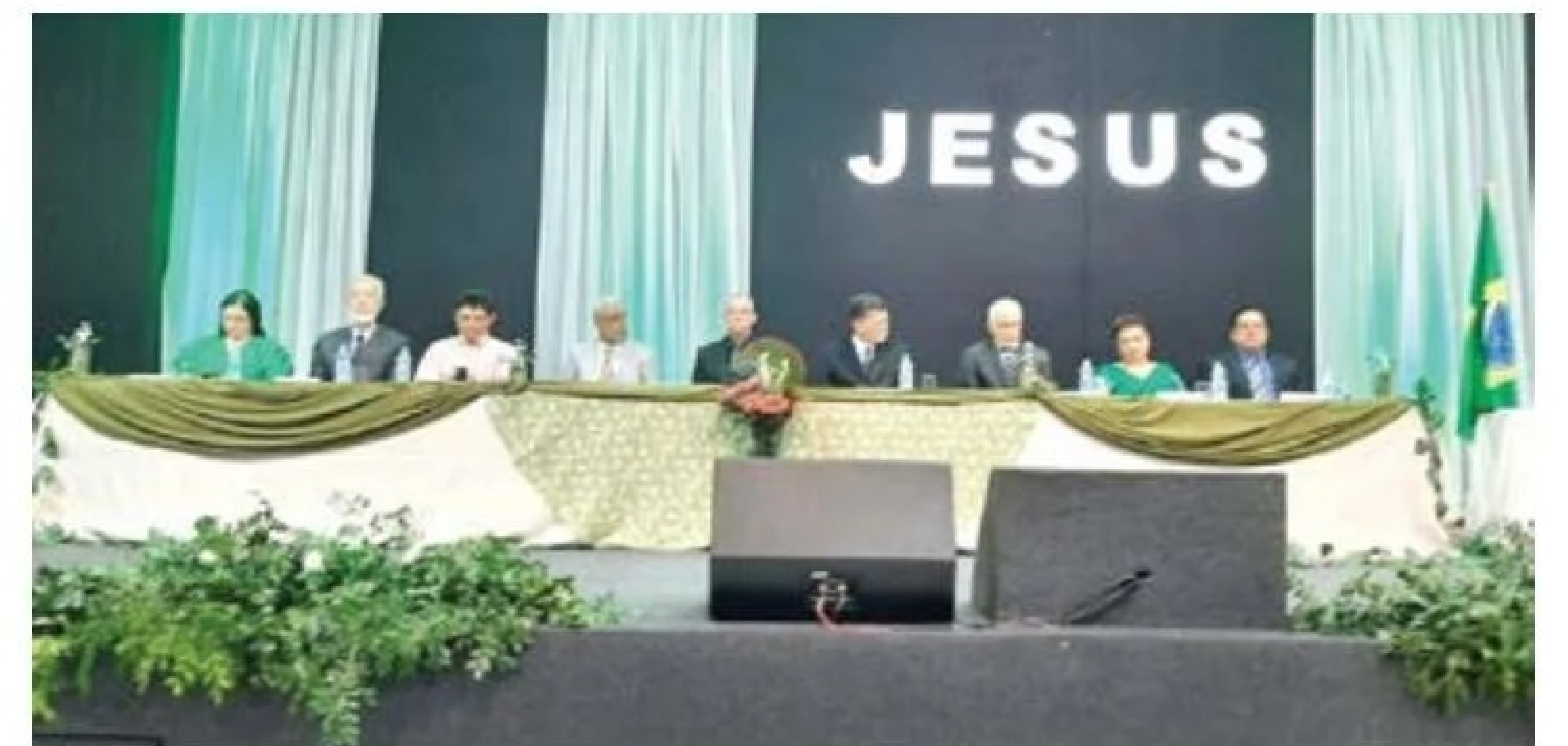
Formatura do Seminário Batista Sul-Mato-Grossense (SBSM) foi realizada no templo da Terceira Igreja Batista de Campo Grande - MS