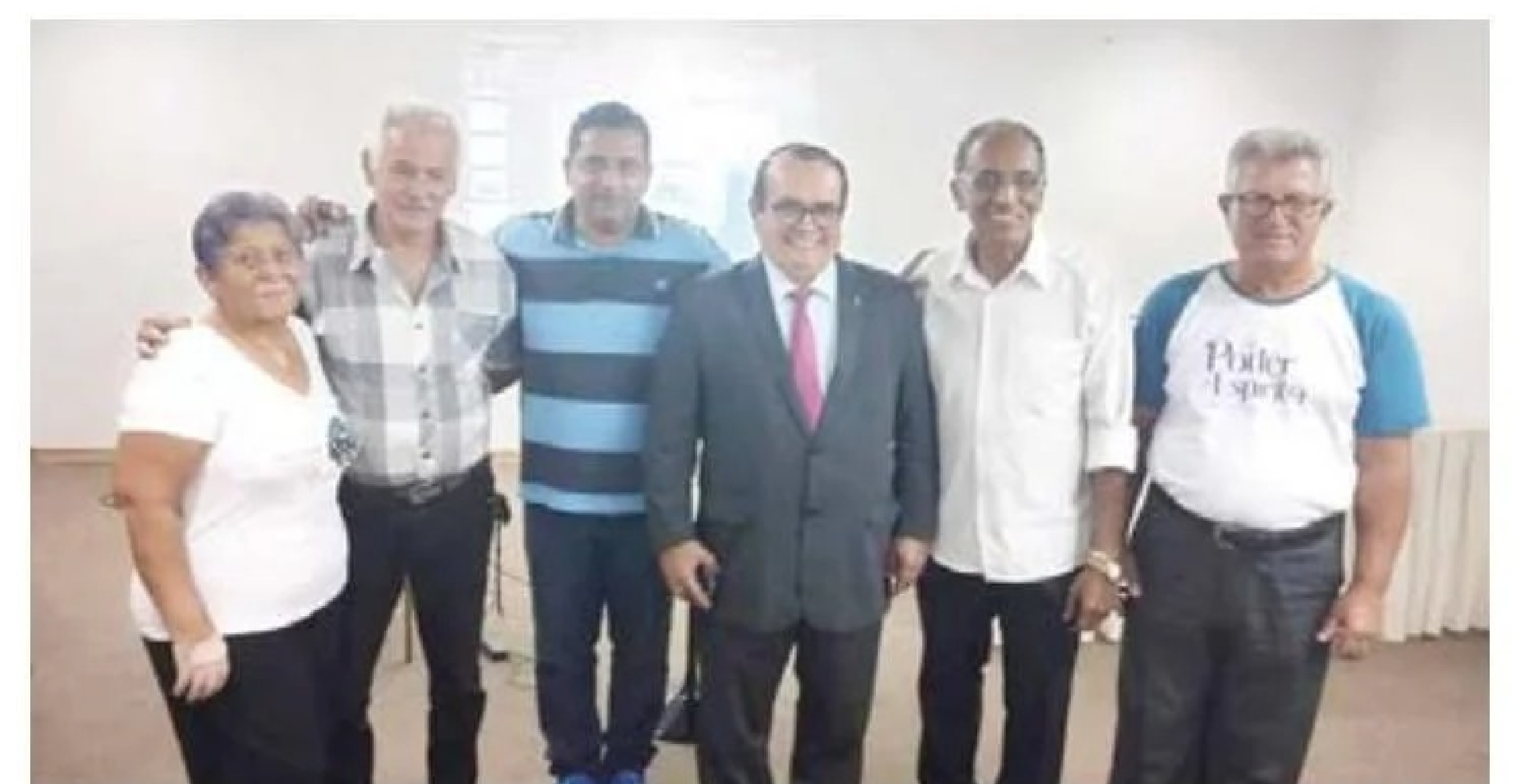
Apresentação do cartão benefício realizado pela Associação Batista Caxiense no auditório do hotel Mont Blanc, em Duque de Caxias - RJ