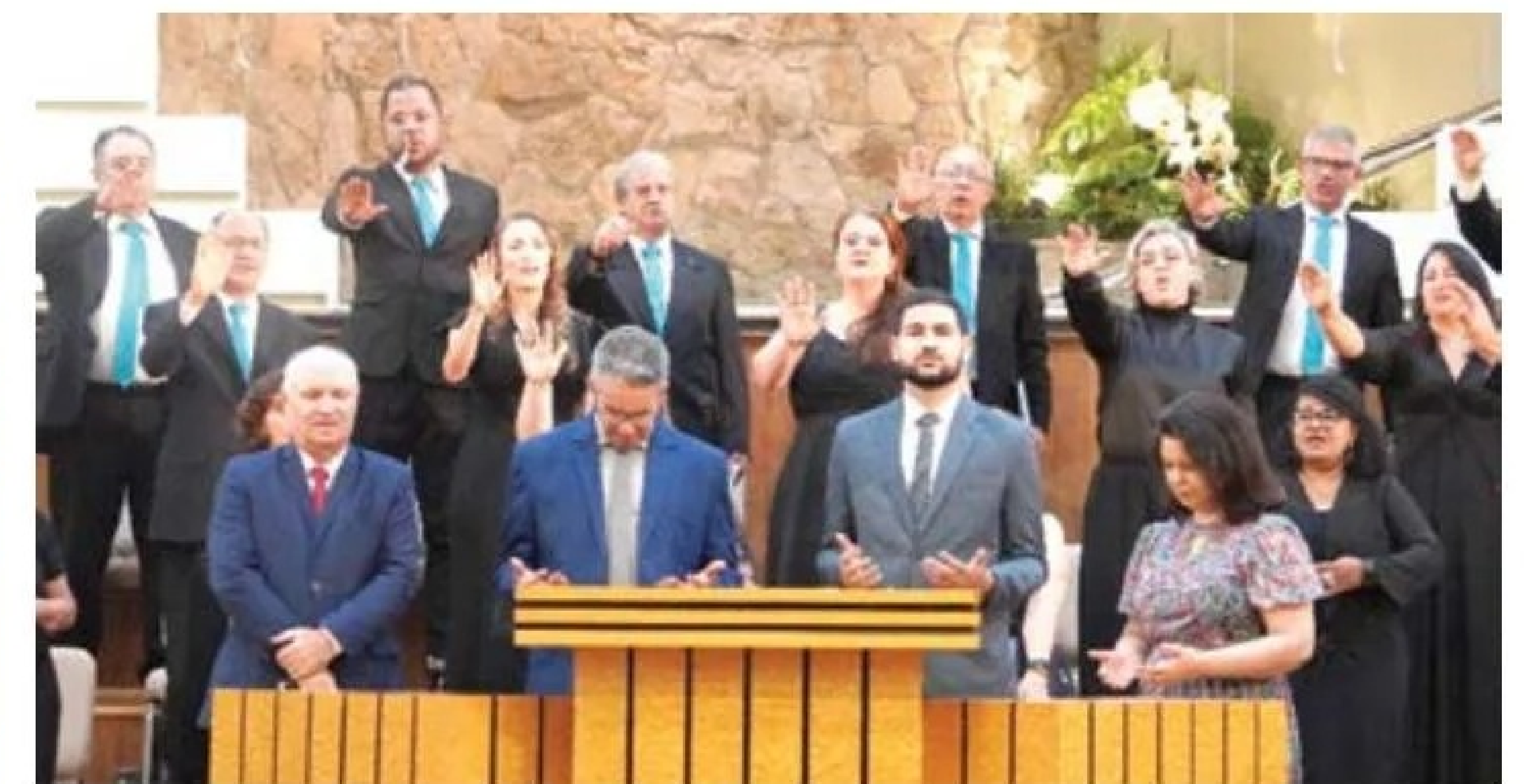
Celebração especial para a posse de novos líderes na Igreja Batista do Barro Preto - MG

grande e as expectativas estão sendo alinhadas no dia a dia com os irmãos e amigos de ministério. É uma nova fase, em uma nova comunidade de Cristo, e nosso desejo é fazer a vontade do Pai amando a Deus e ao nosso próximo".