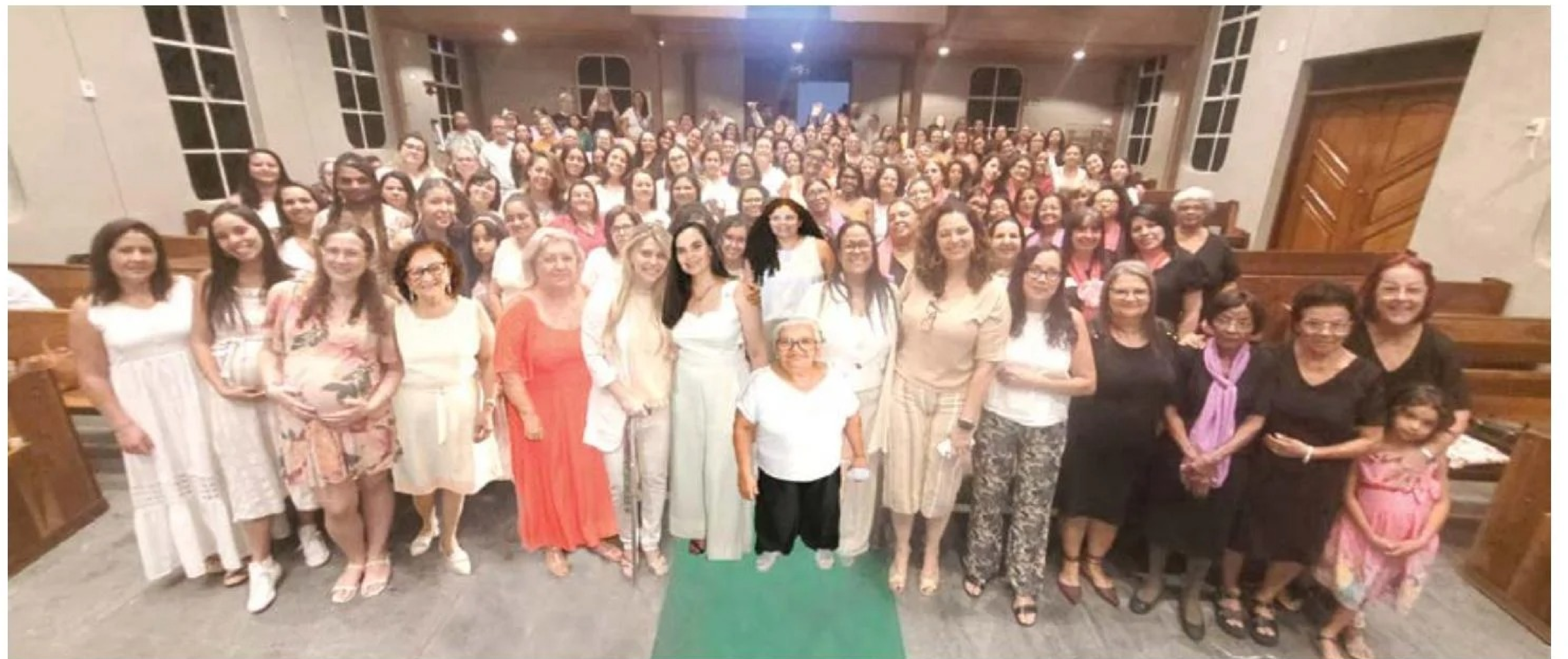
Encontro de mulheres na Terceira Conferência Anual de Mulheres Discipuladoras realizado na Primeira Igreja Batista em Campo Limpo - SP