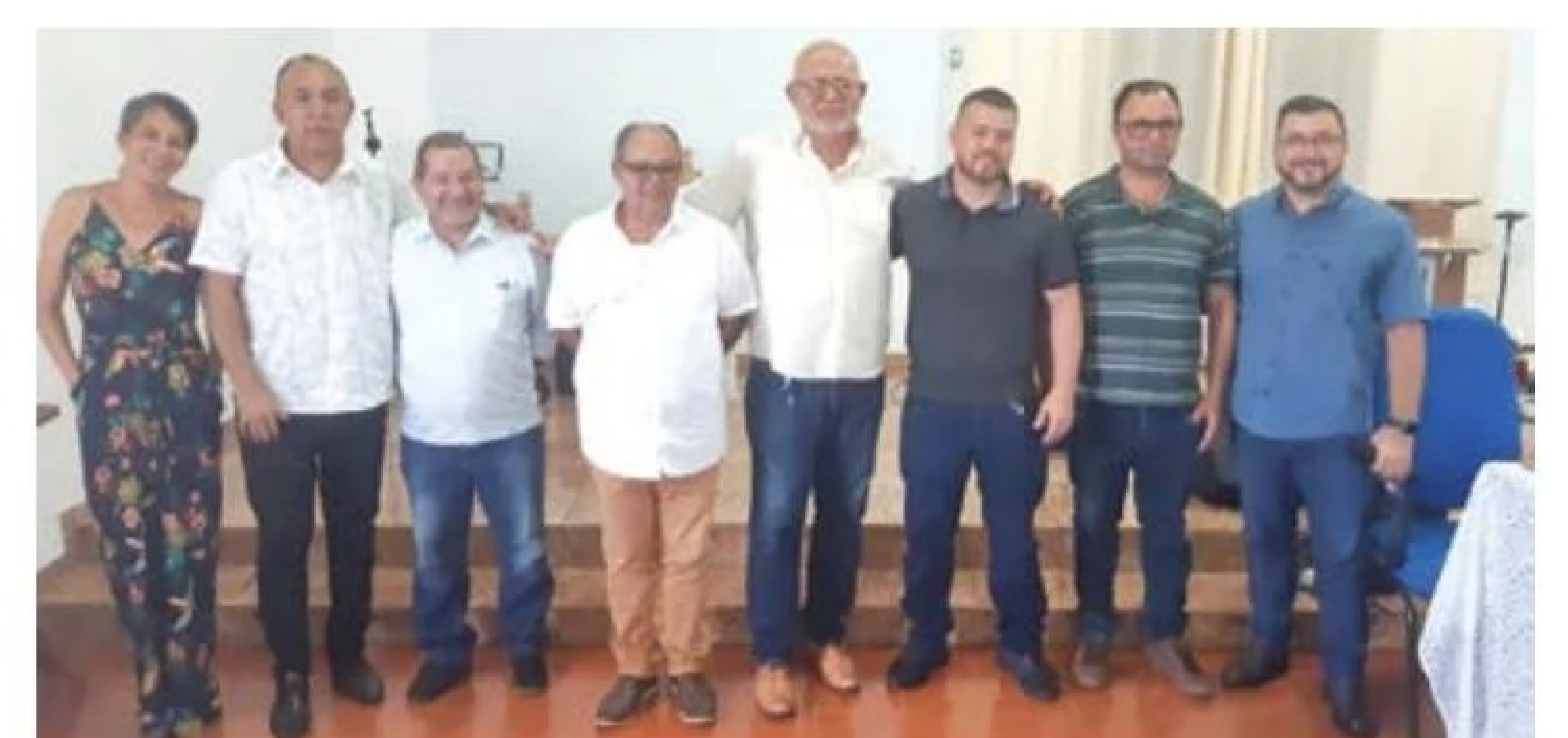
Eleição de nova Diretoria para os trabalhos da Associação na ASSIBANORTE e ACIBAMS