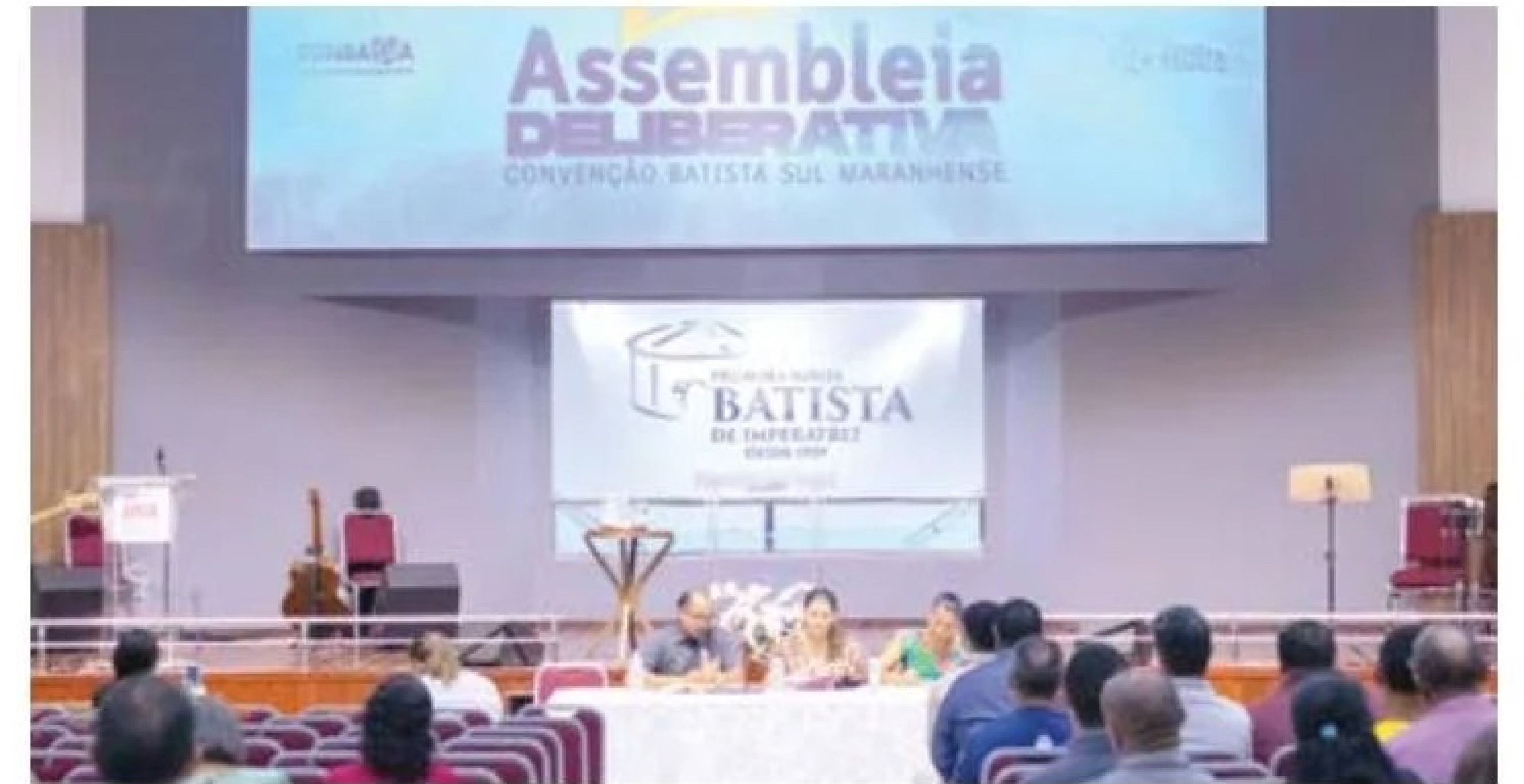
Décima Assembleia Deliberativa da Convenção Batista Sul Maranhense (Conbasma) realizada na Primeira Igreja Batista em Imperatriz - MA

ram pela manhã, às 08h00, com a instalação da segunda sessão, que incluiu relatórios de atividades e financeiros sobre a Conbasma. Às 13h30, teve lugar a instalação da terceira sessão, com as eleições das organizações da Conbasma, incluindo a Juventude Batista Sul Maranhense (JUBASMA), a União Missionária de Homens Batistas Sul Maranhense (UMHBSM) e a União Feminina Missionária Batista Sul Maranhense (UFMBSM).