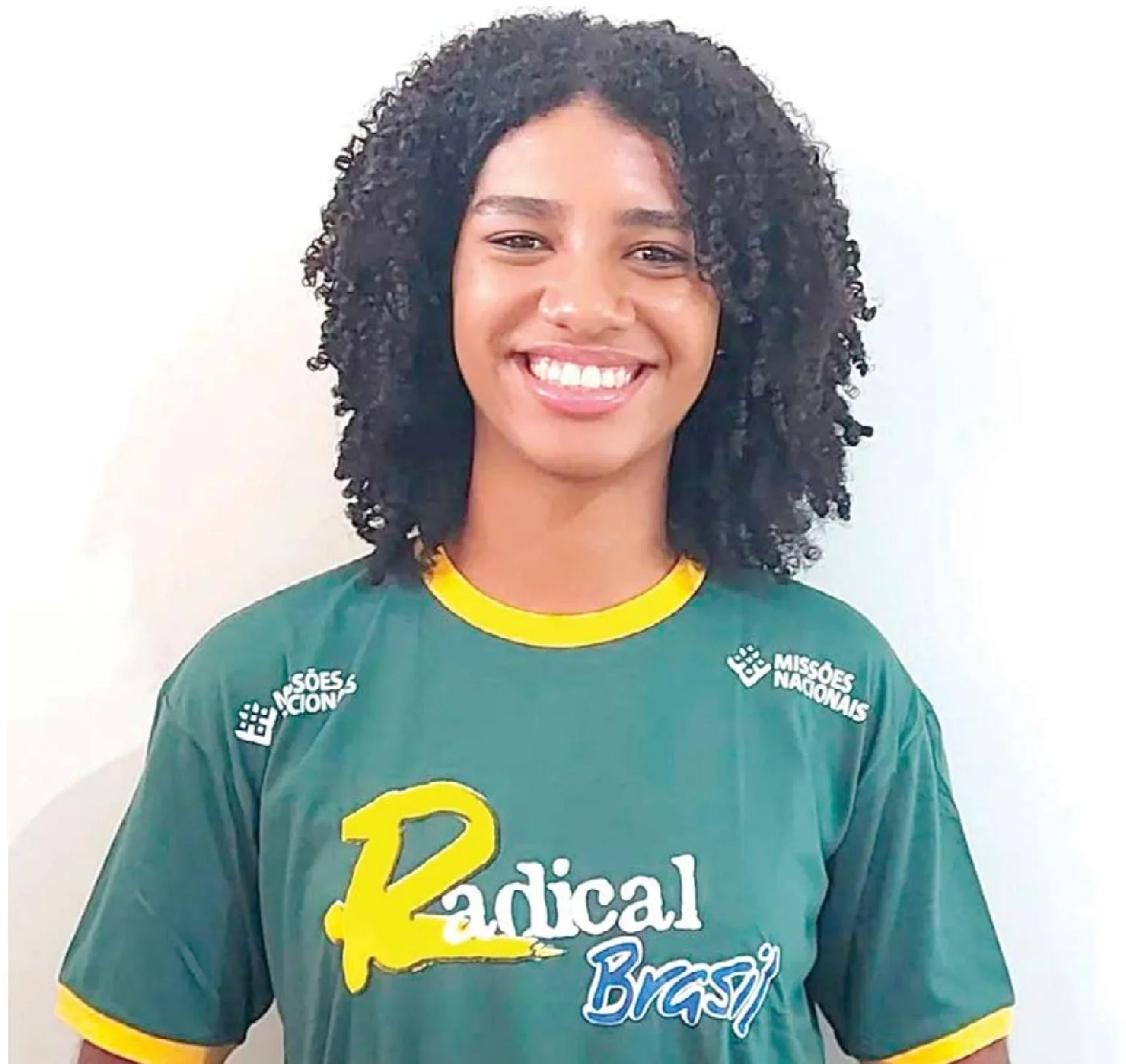
Deus não nos conduz a lugares confortáveis, mas, sim, a locais de crescimento

É um privilégio servir na obra do Senhor. Então, não olhe para si mesmo, nem para as circunstâncias. Olhe para Deus e confie nEle de todo o seu coração. Escolha viver os planos dEle e não os seus, pois a Sua vontade é sempre boa, perfeita e agradável. Lembre-se de que "aquele que começou a boa obra em vocês vai completá-la até o dia de Cristo Jesus" (Fp 1.6). ■