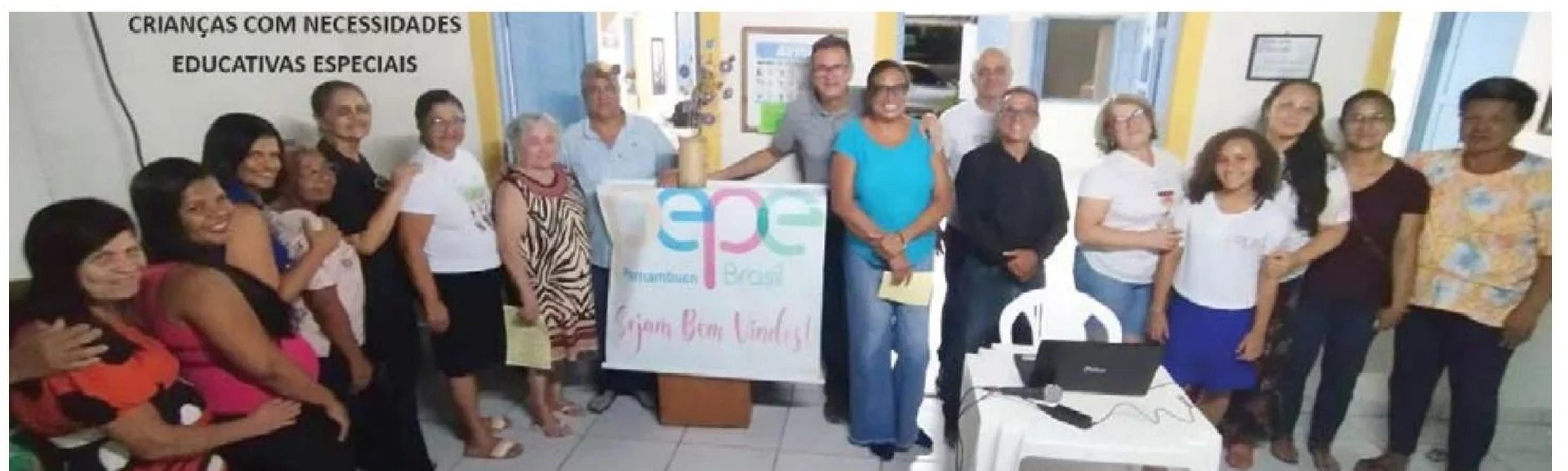
Um grupo dos participantes do simpósio pepe Brasil